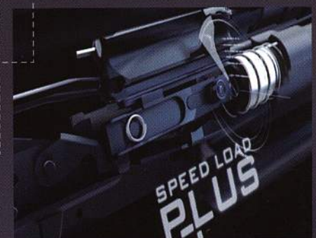
MAXUS HUNTER PREMIUM